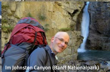
Im Johnston Canyon (Banff Nationalpark)

Am späten Nachmittag stehen wir endlich am Ufer des Berg Lake, wo wir auf dem einfachen, nur noch wenig belegten Zeltareal unser Basislager für drei Nächte einrichten. Am gegenüberliegenden Ufer reicht der Berg Glacier vom Mount Robson bis auf Seehöhe herab. Immer wieder brechen mit eindrucklichem Krachen Eisbrocken ab und treiben über den See. Auch der nächste Morgen verspricht noch gutes Wetter, so dass wir zu einer großen Tagestour aufbrechen. Immer grandioser werden bei unserem Aufstieg die Ausblicke über den Gletscherstrom des Robson Glacier. Drei weiße Schneeziegen steigen mit einigem Abstand vor uns gemächlich den Hang hinauf. Mittags erreichen wir den Snowbird Pass und vor uns erstreckt sich die Eiswüste des Reef Icefield. Auf dem Weg zurück zum Campground genießen wir die einzigartige Aussicht und die warme Herbstsonne. In der Nacht trommelt der angesagte Regen auf die Zeltplane und die Wanderung des folgenden Tages führt uns