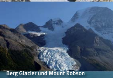
Berg Glacier und Mount Robson