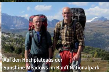
Auf den Hochplateaus der Sunshine Meadows im Banff Nationalpark