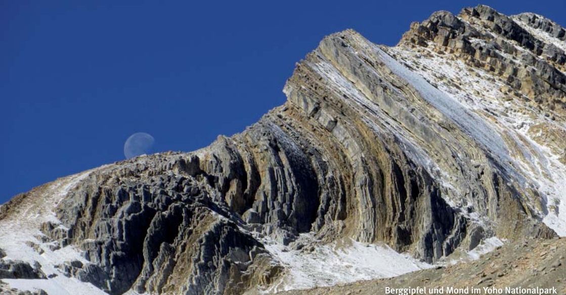
Berggipfel und Mond im Yoho Nationalpark