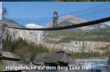
Hängebrücke auf dem Berg Lake Trail