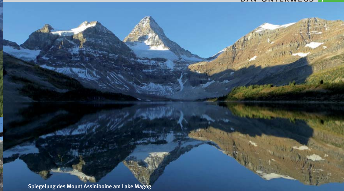
Spiegelung des Mount Assiniboine am Lake Magog