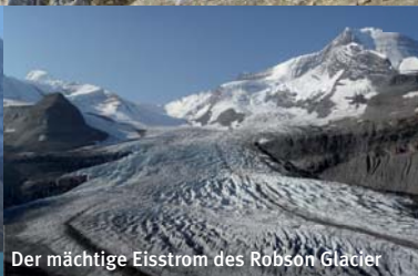
Der mächtige Eisstrom des Robson Glacier