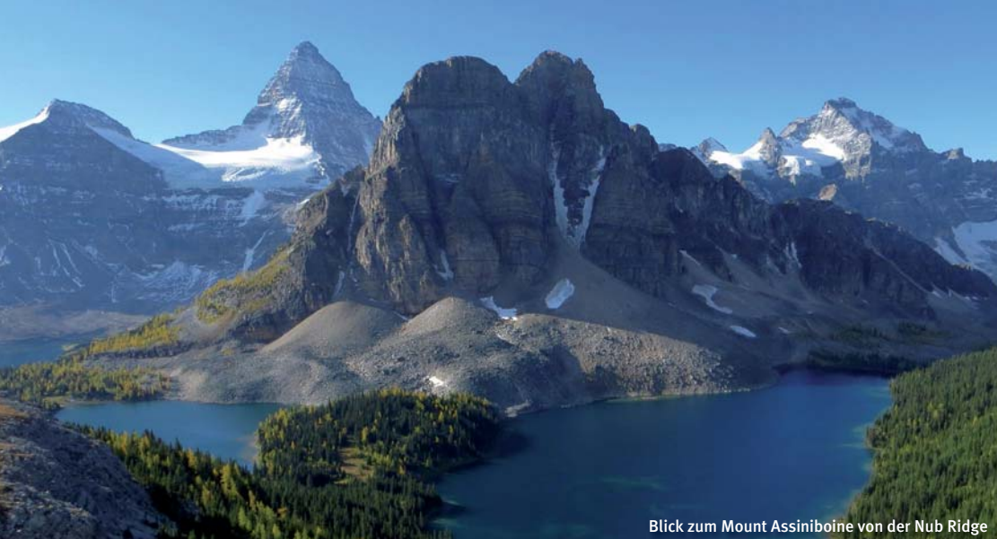
Blick zum Mount Assiniboine von der Nub Ridge