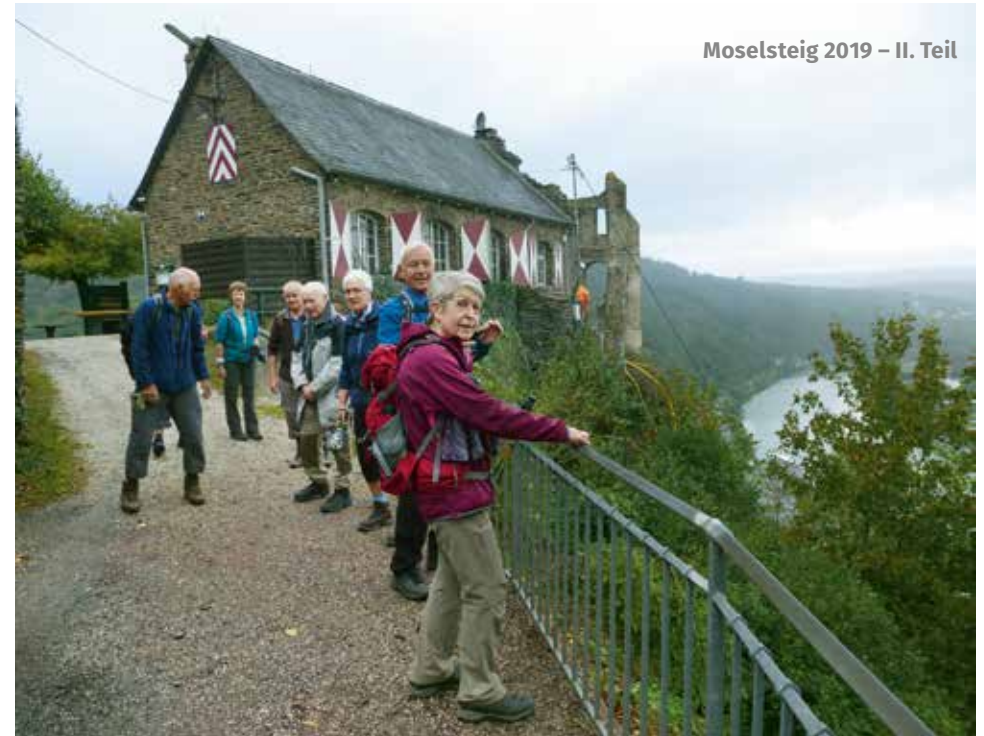
Moselsteig 2019 – II. Teil