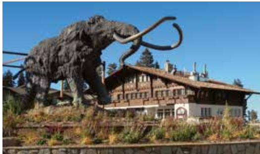
Ein Hauch von Alpen in der Skistation Mammoth Lakes