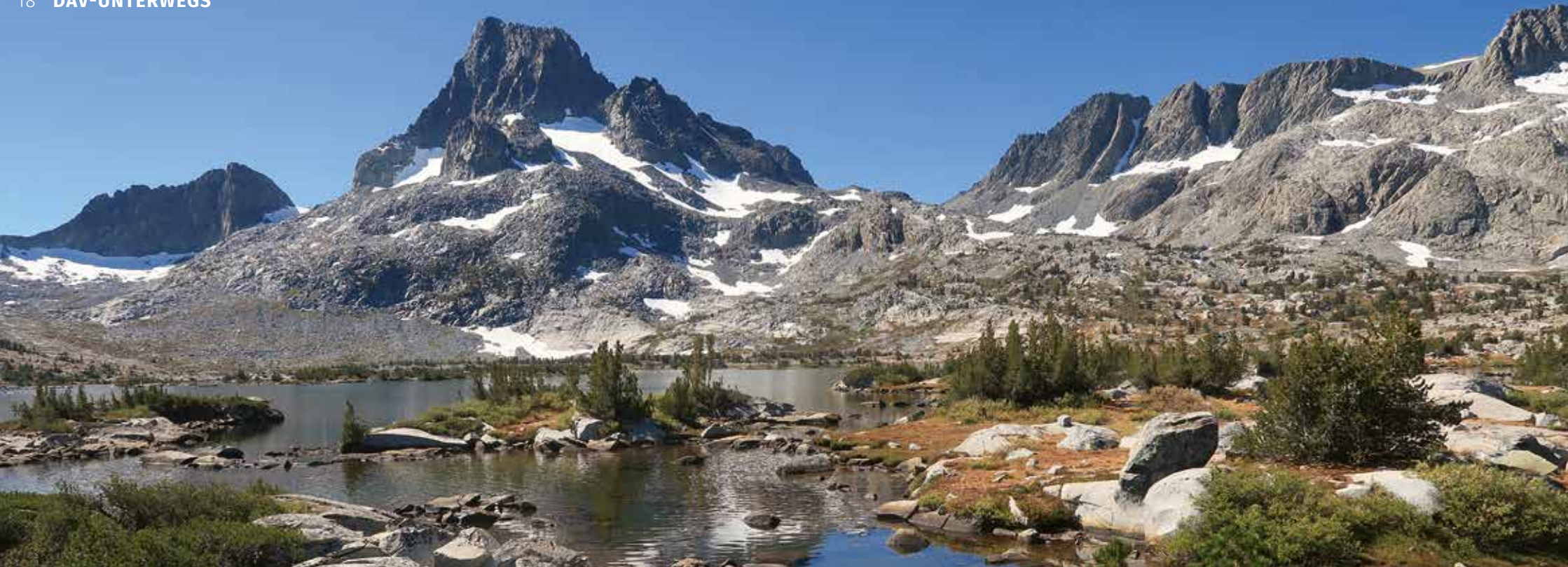
Postkartenidylle am Thousand Island Lake (Ansel Adams Wilderness)