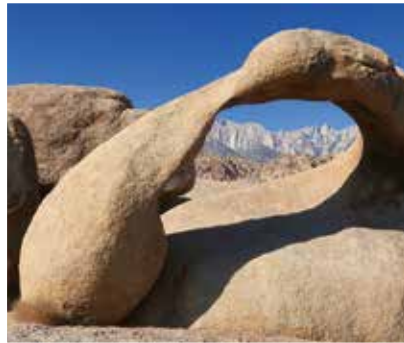
Felsbogen in den Alabama Hills mit Durchblick zum Mount Whitney