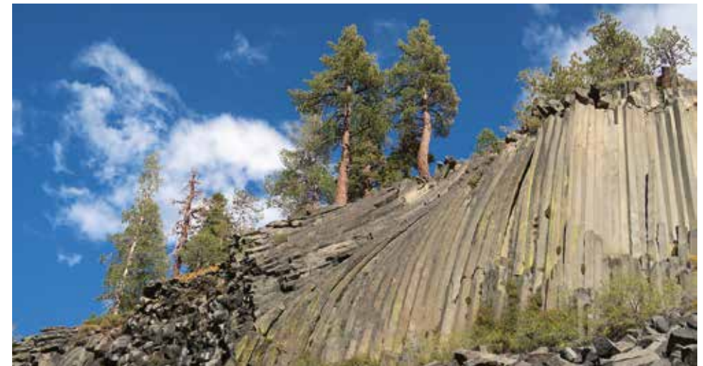
Postkartenidylle am Thousand Island Lake (Ansel Adams Wilderness)

lassen wir erneut die unterhaltenen Trails und stoßen in das wilde Miter Basin vor. Das nahezu ebene einsame Hochtal am Rand des Sequoia Nationalparks wird von schroffen Granitgipfeln eingerahmt, während im Talgrund ein kleiner Bergbach über Felsstufen herabrauscht. Eine sternklare eisige Nacht lässt die Ränder der Bäche und Kaskaden zu durchsichtigen Kunstwerken erstarren. Der treffend bezeichneten Sky Blue Lake ist das Ziel einer kleinen Erkundungstour, bevor wir uns auf die Suche nach einem geeigneten Basislager für den geplanten Gipfelsturm des Mount Langley machen. In der Nacht fallen die Temperaturen erneut deutlich unter den Gefrierpunkt und wir sind froh über unsere dicken Daunenschlafsäcke. Doch wir lassen uns am nächsten Morgen auch nicht vom