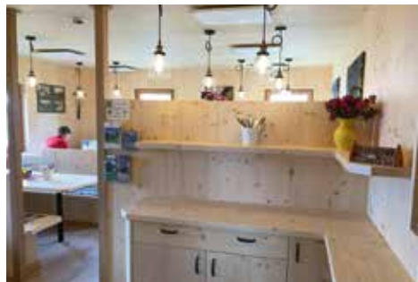
Die neue Stube der Bremer Hütte

Die Aktion fand in dieser Form zum 2. Mal statt und verlief, wie die erste, erfolgreich. Fast 7.000 € blieben für die Sektion nach Abzug aller Kosten übrig. Ein herzlicher Dank gilt