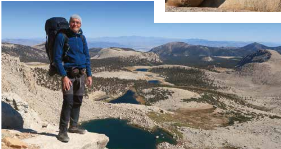
Abstieg vom New Army Pass zu den Cottonwood Lakes (John Muir Wilderness)