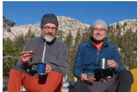
Morgens im Yosemite Nationalparks

Mount Whitney (4421 m) der höchste Berg der Sierra Nevada nahezu 3000 m über dem Owens Valley aufragt. Eine besondere Ansicht des beliebten Gipfelziels, für dessen Besteigung die limitierten Genehmigungen im Rahmen einer Verlosung vergeben werden, ergibt sich durch die formschönen Felsbögen der Alabama Hills bei Lone Pine. Wir haben bewusst auf das Glücksspiel verzichtet und bereits im Voraus per Internet für unsere letzte Tour ein Permit reserviert. Mit charmantem Lächeln überreicht uns eine junge Angestellte die Genehmigung für eine fünftägige Runde in der Bergwelt südlich des Mount Whit-