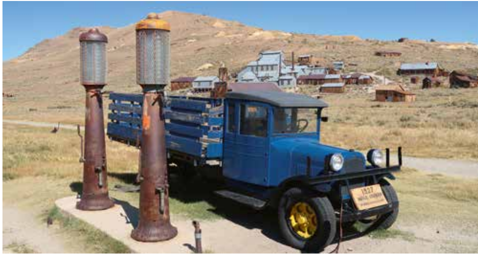
Die verlassenen Minen in der Geisterstadt Bodie

Zelt auf diese majestätische Bergszenerie hinterlassen vor allem eines: Sehnsucht oder vielleicht eher Seensucht. Bei einem Ausflug mit leichtem Gepäck erklimmen wir eine Passhöhe, wo ein zwischen den beiden Bergen eingezwängter Gletscher und der von ihm gespeisten See vor uns liegen. Über einen herrlichen Panoramaweg mit wunderbaren Weitblicken kehren wir nach vier traumhaften Tagen zum Startpunkt und in die Zivilisation des großen Wintersportortes Mammoth Lakes zurück.